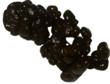
Crottes molles Cæcotrophes